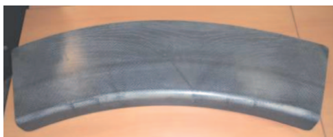
Pièce de démonstration TOUPIE